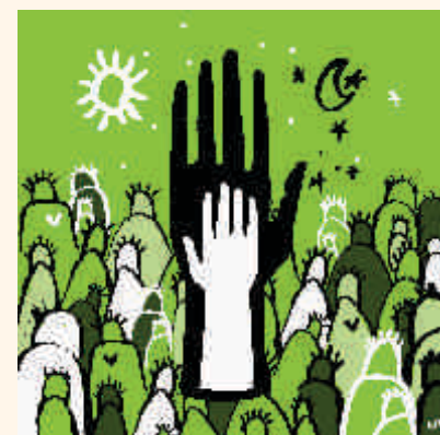
Cuidado y Protección